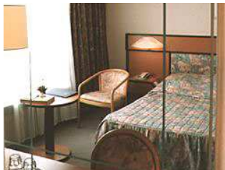
Moscou : hôtel « Cosmos »

Standard : Logements en hôtels 3* (norme locale), avec salle de bain et sanitaires dans la chambre. Petit-déjeuner compris