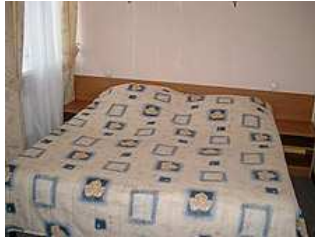
Moscou : hôtel « Tourist »

Touriste : Logements en hôtels 2* (norme locale), avec salle de bain et sanitaires dans la chambre. Petit-déjeuner compris