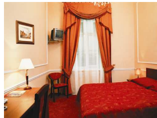
Saint-Pétersbourg : hôtel « Art-Hotel »