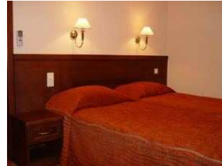
Saint-Pétersbourg : hôtel « A l'Ermitage »

Standard : Logements en hôtels 3* (norme locale), avec salle de bain et sanitaires dans la chambre. Petit-déjeuner compris